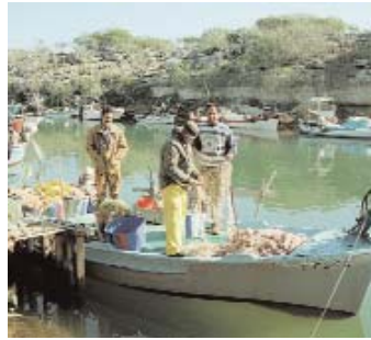
Pescadores en el río Liopetri, Chipre.

La economía chipriota está creciendo rápidamente y funciona en una situación de pleno empleo. El sector primario (agricultura, silvicultura y pesca) supone el 4,6% del PIB de Chipre y el 9% del empleo. La industria (principalmente manufacturas y construcción) contribuye con el 19,7% del Producto Interior Bruto y el 31% del empleo, pero es sin duda el sector servicios, en particular el turismo, la principal actividad económica de Chipre: 74% el PIB total y el 60% del empleo.