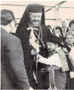
Acto de colocación de la primera piedra por el Arzobispo Makarios en el año 1966.

Chipre logra la independencia en agosto de 1960, tras el Acuerdo de Zurich entre Gran Bretaña, Turquía y Grecia con el arzobispo Makarios como presidente. A partir de este momento, la mayoría griega exige la anexión a Grecia (enosis), mientras la población turca se opone, iniciándose el conflicto entre las dos comunidades. Naciones Unidas envía en 1964 una misión para el mantenimiento de la paz (UNICYP) que a la postre resulta insuficiente.