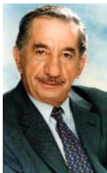
Tassos Papadopoulos, actual presidente de la República de Chipre.

La Cámara de Representantes chipriota es unicameral y sus miembros se eligen por sufragio universal para un periodo de cinco años. Está compuesto por 80 diputados, 56 grecochipriotas y 24 turcochipriotas, que no están presentes en el Parlamento desde 1964. Ejerce el poder legislativo.