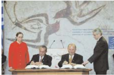
Firma del Tratado de Adhesión. (De izquierda a derecha: Tassos Papadopoulos, Presidente, y Georgios Iacovou, Ministro de Asuntos Exteriores de Chipre.)

Las relaciones entre la Unión Europea y Chipre han estado reguladas por el Acuerdo de Asociación, firmado en diciembre de 1972, y cuya entrada en vigor se produjo en junio de 1973. El objetivo de este acuerdo era el establecimiento de una unión aduanera a través de relaciones comerciales y cooperación financiera y técnica, pero no incluye el diálogo político, a diferencia de los Acuerdos Europeos firmados con los países de Europa Central y Oriental.