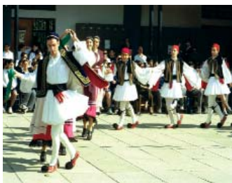
Baile tradicional de los griegos chipriotas durante la celebración del día nacional.

La población de la isla es de 908.100 habitantes, de los que 793.100 viven en la parte greco-chipriota. La mayoría es helénica ortodoxa (77 %), seguida de la población turca (18 %). El 5 % restante está formado por diferentes grupos étnicos y confesionales como maronitas, armenios y latinos.